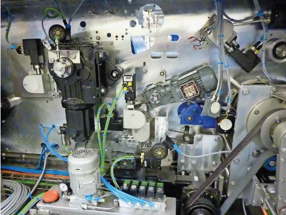
Fünf Siko-Positionierantriebe sorgen für automatisierte Formatwechsel.